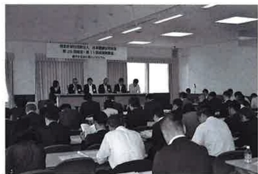
毎年5月の総会で各部会の研究成果を報告

成する9つの部会だ。東京・大阪にそれぞれ置かれる空気環境部会では、生活・嗜好・趣味由来による化学物質発生の抑止及び濃度過多を招かないライフスタイルを実